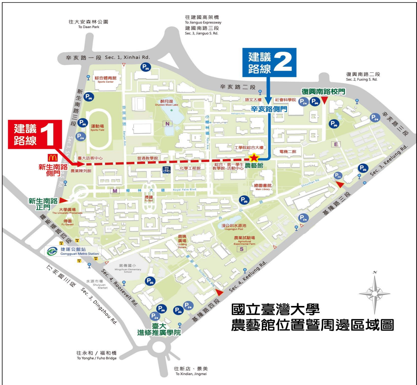
國立臺灣大學 農藝館位置暨周邊區域圖